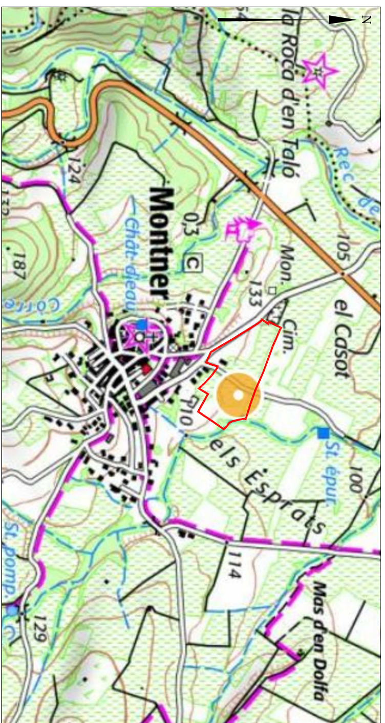
Extrait de carte IGN - 1/115 000