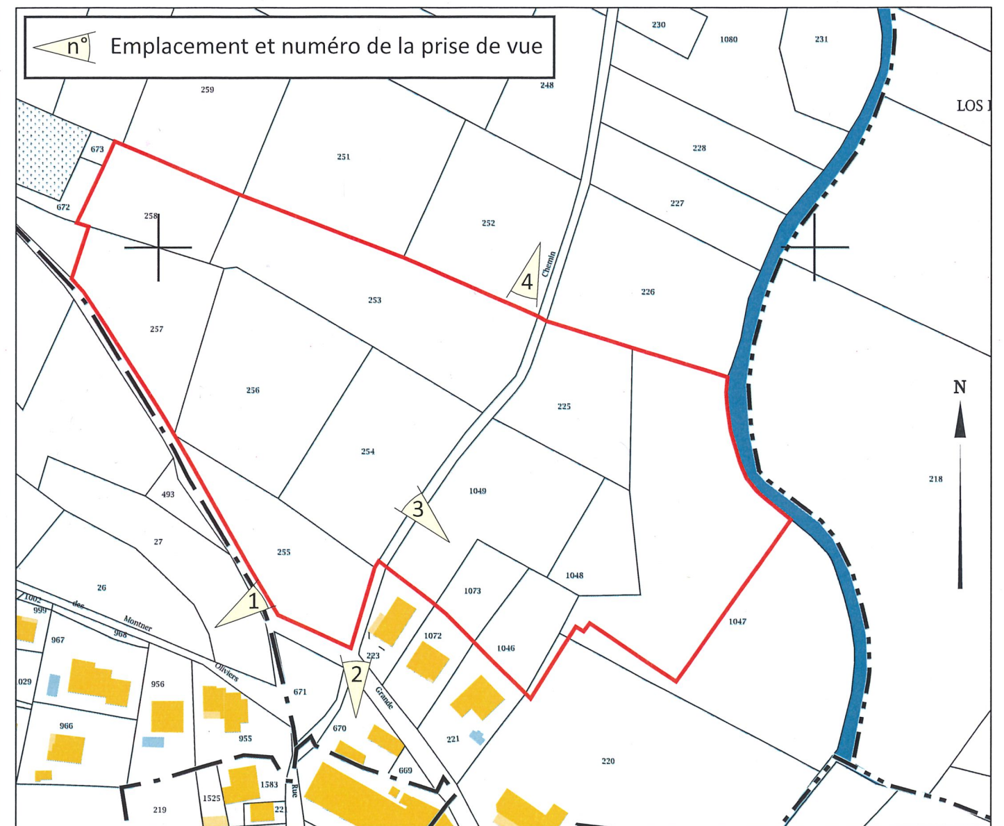
Extrait cadastral - 1/5000